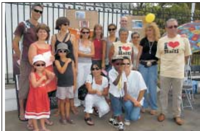
Le collectif de parents manifestait le 12 février dernier devant le jardin de l'Etat.

« On promettait depuis quelques semaines à 117 autres familles françaises l'évacuation prochaine de leurs enfants. Avec la visite mercredi de Sarkozy à Haïti, on s'attendait à un coup d'éclat. Qu'il les ramène avec lui... Ou tout au moins qu'il annonce leur départ imminent. On attendait cela avec impatience. Tous ces enfants ont été attribués pour certains depuis plusieurs années à leurs parents adoptants, bien avant le séisme. Et on vient d'apprendre par un communiqué de l'Etat français qu'il n'est finalement plus du