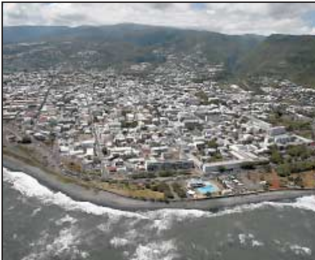
Dans son étude, la maison de l'Emploi du Nord a détaillé les chiffres de l'emploi et du chômage quartier par quartier, après avoir découpé le chef-lieu en 53 secteurs distincts.

Le taux de chômage dionysien, avec sa moyenne de 25,2%, est loin d'être uniforme : s'il ne dépasse pas les 11% du côté du jardin de l'Etat, ce taux s'avère de 50% à commune Primat. Au Chaudron, suivant les secteurs, il oscille entre 40 et 45%, comme le révèle une étude de la maison de l'emploi du Nord.